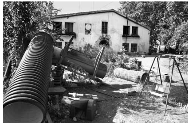
Kan Pasqual ja fa més de quinze anys que dona vida i defensa la Serra de Collserola

ara, s'han mogut pocs fils per fer-ho. Això no tan sols evidencia el poc interès de la classe política envers aquestes qüestions, sinó que fa que hi hagi el risc que la redacció del nou document es faci amb presses i malament.