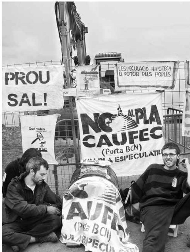
Acció contra les obres del Pla Caufec el 19 de maig de 2008

Finalment, el 2010, la Generalitat de Catalunya va declarar Collserola parc natural –incloent 779,29 hectàrees més que el PEIN– i va establir les reserves naturals parcials de la Font Grogia i la Rierada-Can Balasc. Però aquest nou estatus, tal com havien denunciat les entitats defensores de la serra, no incorpora algunes de les seves reivindicacions: per exemple, que la superfície del parc sigui més gran que l'àmbit d'actuació del PEPCo o la desestimació de la inclusió dins el parc d'espais de regulació especial (ERE), àrees naturals vinculades a la trama urbana on sí que es poden dur a terme transformacions urbanístiques. A més, el termini fixat pel decret de creació del parc natural (Decret 146/2010) per redactar un pla especial que substitueixi l'actual PEPCo finalitza el proper mes d'octubre i, fins