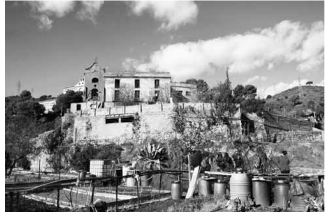
Els horts comunitaris i el Punt d'Interacció de Collserola són dos dels pilars de Can Masdeu

Col·lectius com la Plataforma Cívica per a la Defensa de Collserola (PCDC), el Col·lectiu Agudells, Kan Pasqual, Parem el Pla Caufec o Can Masdeu s'han significat en la defensa de la serra